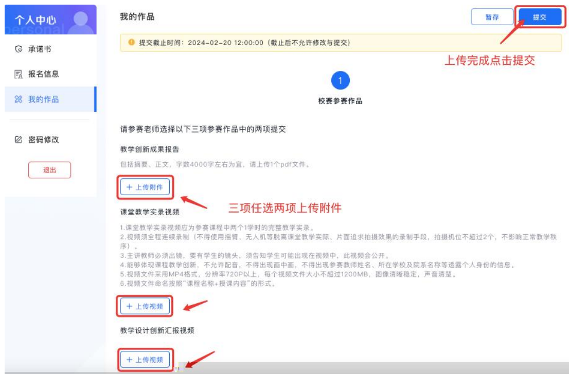
图 5 作品 上传

【我 作品】中 择 学创 成 报告、 堂 学实录 、 学 创 报 三 参 中任意两 ， 击对应【上传 件】按 完成上传， 择 右上 【 交】完成即可，如图 5 所 。