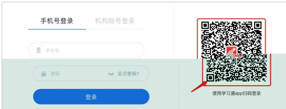
图 2 师手 号或扫 录

录 右 使 学习 app 扫 ， 册学习 师可使 动 备在 应 市场或 AppStore 中 “学习 ” 并下 ， 使 手 号即 录学习 后扫 ， 如图 2 所 。